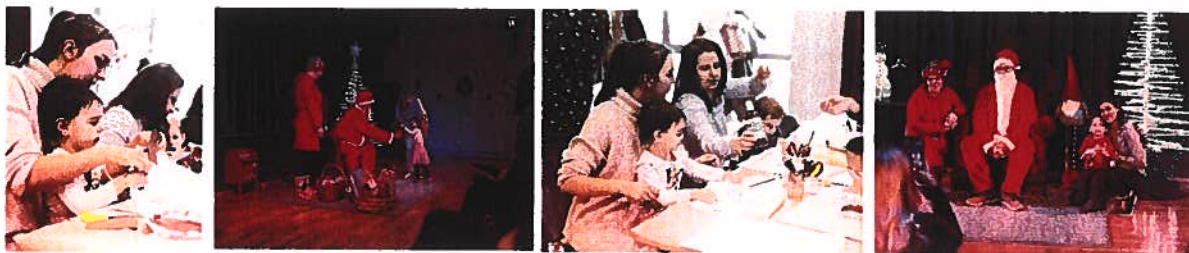
Jöjj el Mikulás! – Mikulásváró a Nemzedékek terén